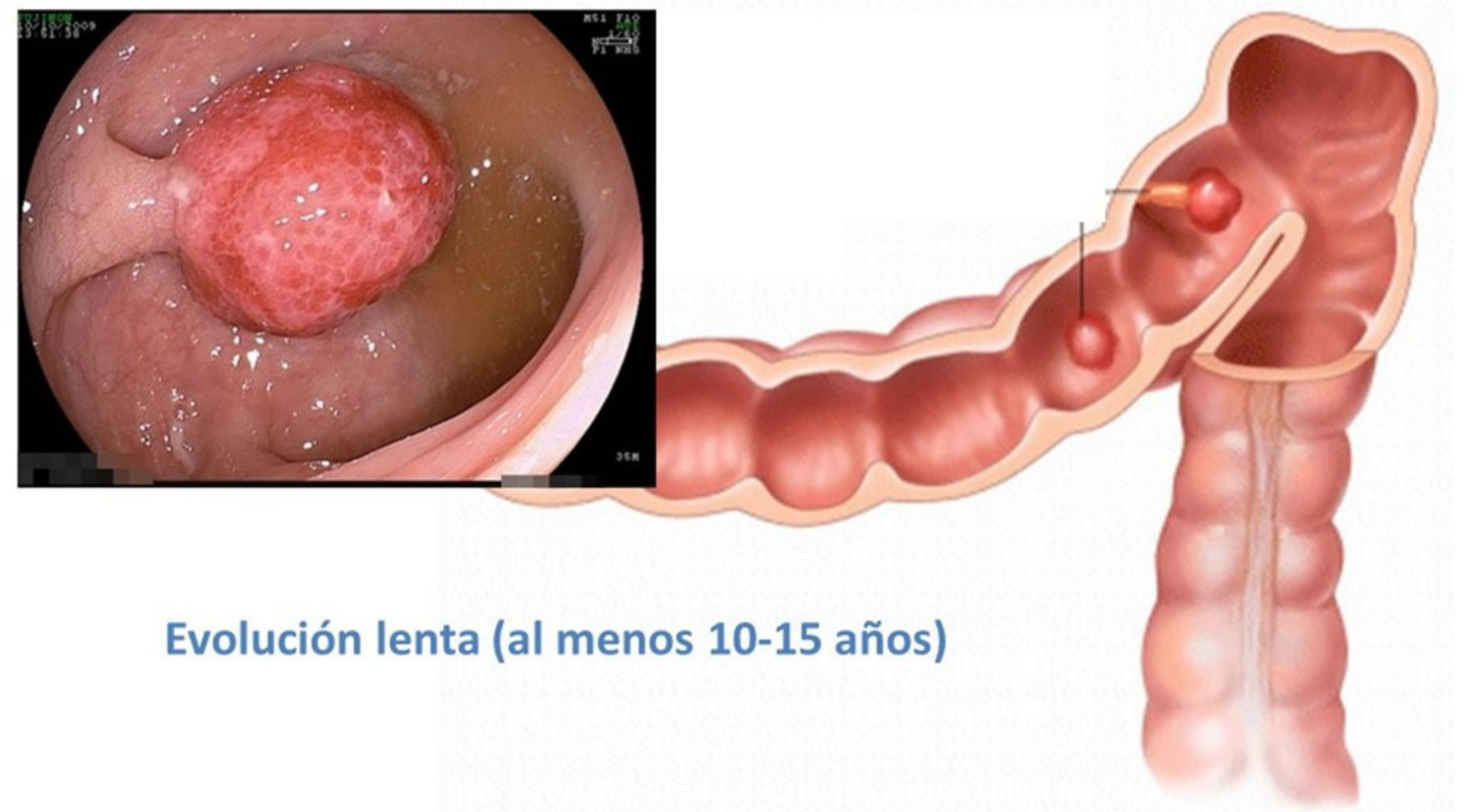
Evolución lenta (al menos 10-15 años)